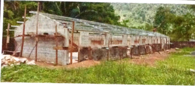
Foto 1: Se observa el avance en la colocación de block de las paredes de las aulas.