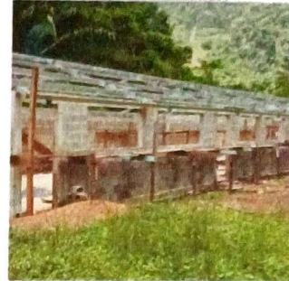
Foto 2: Se evidencia el avance en la instalación de la estructura metálica del techo.